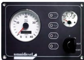
B3 220 x 145 mm