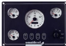
C3 270 x 188 mm